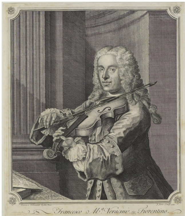
Francesco Maria Veracini